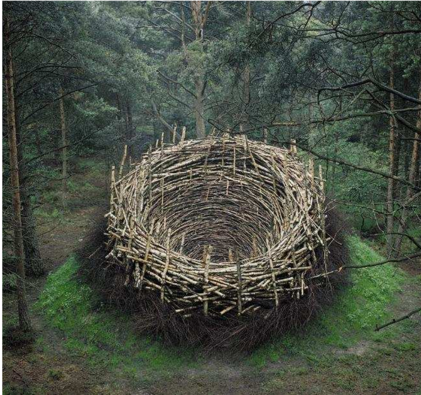
Nils Udo, Le Nid (1978, Allemagne)

Pièce également remarquable du salon, la construction du plasticien belge Wim Delvoye qui présenta quant à lui sa monumentale « pelleteuse gothique ». Du côté de la photographie, cet événement nous a permis de nous replonger dans plusieurs clichés mythiques qui ont fait le tour du monde: le célèbre Jim Morisson par Joel Brodsky, ou encore Kate Moss immortalisée par le talentueux Peter Lindbergh. Les amateurs de Land-Art ont pu admirer les oeuvres de l'allemand Nils Udo et notamment Le Nid .